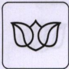
Tabulka č. 2